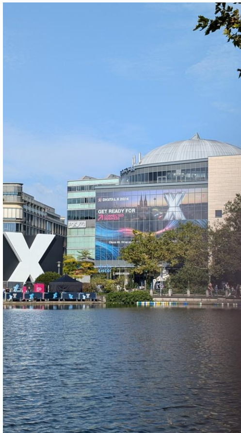
Bildtitel: DIGITAL X rund um den Mediapark Köln