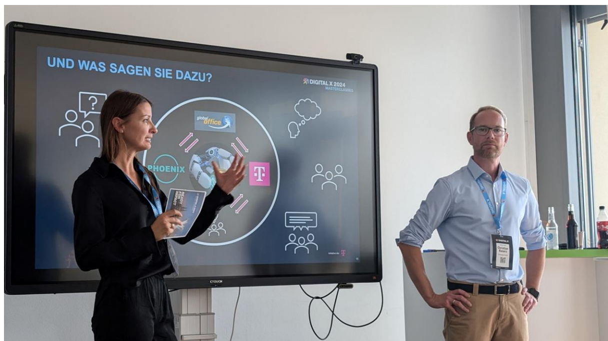
Bildtitel: Masterclass zur Conversational AI: Wie Kunden KI (er) LEBEN

Die global office GmbH ist ein führender Premium-Anbieter von Kommunikations- und Erreichbarkeitslösungen für Unternehmen. Mit seinen Telefonengeln bietet das Unternehmen ein breites Portfolio, das klassische Telefonie und innovative digitale Kommunikationskanäle wie Voicebots umfasst. Es unterstützt Unternehmen und Behörden bei der Optimierung ihrer Kundeninteraktionen und der Steigerung ihrer Effizienz.